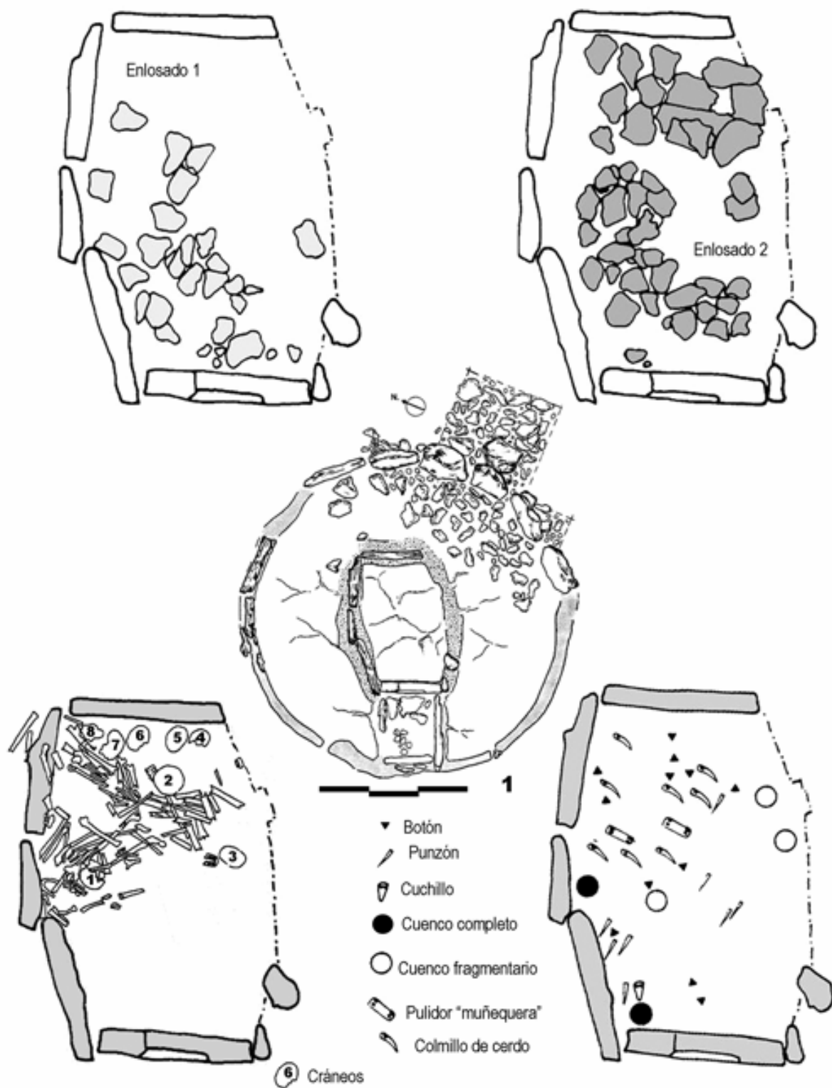
Registro arqueológico de la cámara funeraria